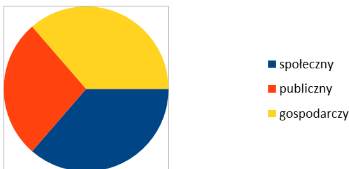
Podział członków Rady według przynależności do sektora

Rada wybiera ze swojego składu Przewodniczącego, jego Zastępcę i Sekretarza. Przewodniczący Rady wraz z pracownikiem biura (na zasadzie dwóch par oczu) czuwają nad przebiegiem głosowań, w tym obliczają wyniki głosowania członków Rady oraz wykonują inne czynności o podobnym charakterze, w tym czuwają nad prawidłowością dokumentacji, zgodności formalnej.